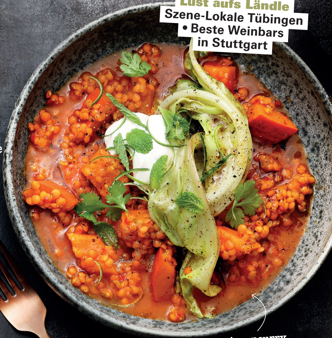
Linsencurry mit Kürbis und Spitzkohl

Lust aufs Ländle Szene-Lokale Tübingen • Beste Weinbars in Stuttgart